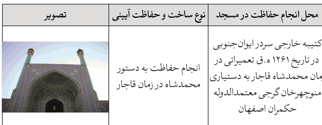
▼ جدول ۴: محل انجام موارد ساخت و حفاظت‌های آیینی در مسجد جامع عباسی (منبع نگارنده)

از دلایل انجام حفاظت آیینی، درخواست پادشاه و حاکم هر دوره برای تغییر، الحاق بخشی به بنا و یا انجام حفاظت در آن می‌باشد. در مورد این بخش از بنا نیز بر طبق متون تاریخی به جا مانده از آن مشاهده می‌شود که، در زمان قاجار به دستور ناصرالدین شاه تعمیراتی در مدرسه ناصریه اتفاق افتاده است و به همین سبب نام این قسمت از مسجد که در گذشته با نام مدرسه عباسی شناخته می‌شده به مدرسه ناصری تغییر پیدا کرده است. جدول شماره چهار بیان‌کننده این موارد می‌باشد.