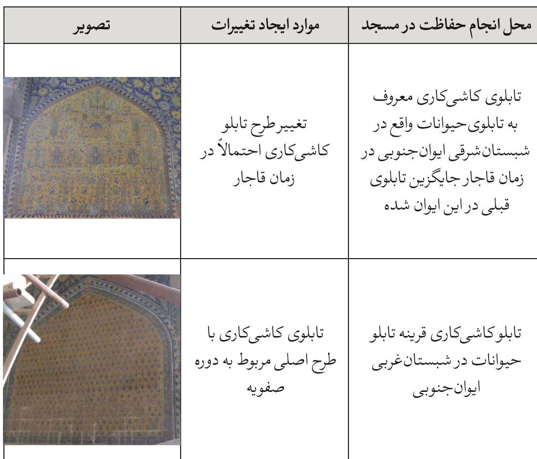
▼ جدول ۵: محل انجام تغییرات در مسجد جامع عباسی

به تصاویر کتاب ارنست هولستر عکاس و جهانگرد آلمانی با نام «ایران در یکصد و سیزده سال پیش» چاپ سال ۱۳۵۴ و مقایسه آن‌ها با طرح امروزی گنبد می‌باشد. هولستر در زمان ناصرالدین شاه قاجار به ایران و شهر اصفهان سفر کرده و عکس‌هایی از مسجد جامع عباسی تهیه نموده است. با توجه به اینکه در دوره بعد از قاجار، یعنی در زمان پهلوی شیوه حفاظت سازمانی در خصوص حفاظت از ابنیه تاریخی معمول شده است و در این زمان حق دخالت و تغییر شکل و فرم در بنا را نداشته‌اند؛ می‌توان گفت که احتمالاً این تغییر و اتفاق نیز در زمان قاجار رخ داده است البته این مسئله نیز جای تحقیق و پژوهش بیشتری دارد. در پایان تصاویر محل‌های ذکر شده در قالب جدولی به صورت زیر ارائه می‌گردد.